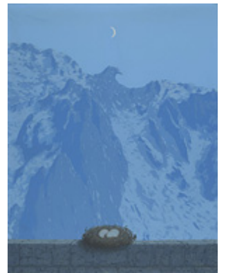
Le Domaine d'Arnheim, 1962

2/ Créez une nouvelle image en mêlant deux éléments existants apparentés ou non